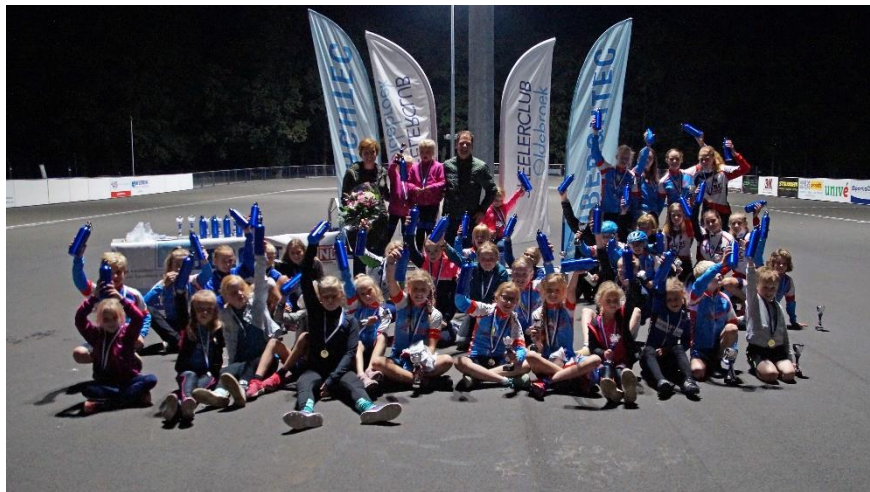
12. Finale Berghtec competitie