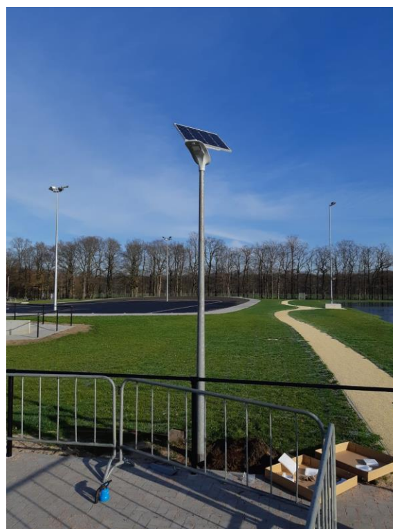
Lichtmast op zonne-energie beschikbaar gesteld door G. Kroeze dienstverlening.