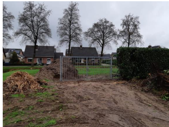
Plaatsing nieuw hek