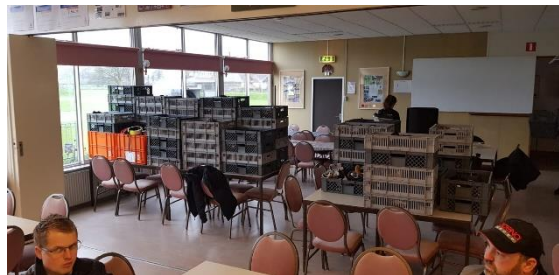
Figuur 13. Activiteiten NL Doet

Het seizoen startte weer met de NL Doet dag. Op zaterdag 16 maart werden de reclameborden weer rondom de baan geplaatst, de inhoud van de skeelerkar gesorteerd, de clubkleding geteld, gesorteerd en in nieuwe bakken opgeruimd.