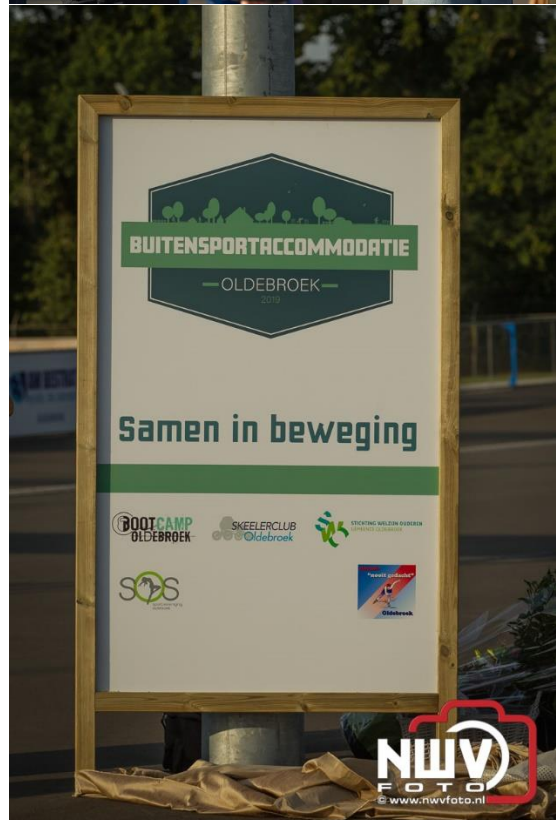
Onthulling logo Buitensportaccommodatie