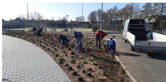
Aanleg tuin aangelegd en gesponsord door Wilfred Meijer tuinen, Oldebroek