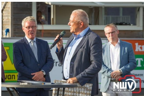
De gemeente Oldebroek schenkt een watertappunt aan de Buitensport acc.