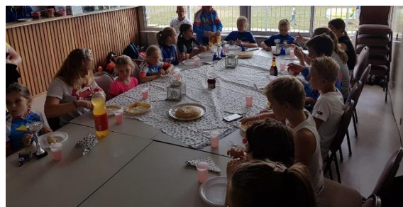
Figuur 17. Pannenkoeken na clubkampioenschap