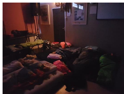
Figuur 21. Slaapparty 2019

In het laatste weekend van het seizoen werd er traditiegetrouw van vrijdag- op zaterdagochtend een slaapparty gehouden in het clubgebouw. Nadat eerst de jongste jeugd deel had genomen aan een mini-elfstedentocht, was het tijd voor de bonte avond. Er werd wat afgelachen. Na een lange avond was het tijd voor een korte nacht en na het ontbijt was het moment gekomen om de laatste ronde van het seizoen 2019 te rijden.