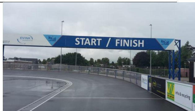
Opbouw start/finish boog / trust