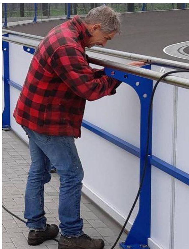
De laatste loodjes qua boarding