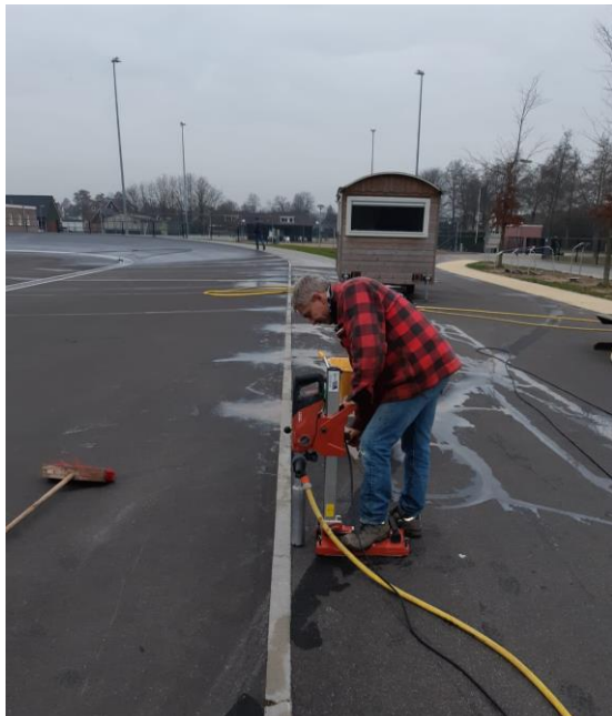
Start montage boarding: 104 gaten boren in asfalt en klinkers.

De piste is in seizoen 2018 neergelegd en geasfalteerd. Vanaf juli 2018 werd al op getraind, maar de piste was nog niet af. Dit zijn de werkzaamheden in de periode januari – juni 2019.