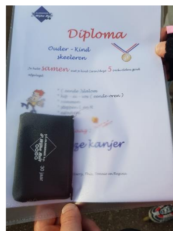
Figuur 18. Ouder-kind skeelers

Dinsdagavond 18 juni vond het (groot)ouder-kind skeelers plaats. Regina had ook dit jaar weer mooie oefeningen gepland, waar (groot)ouders en kinderen veel plezier aan beleefden. Na afloop ontving iedereen een diploma.