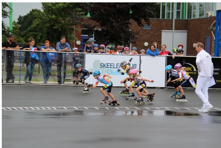
11. Stouwdam competitie Oldebroek

Na de finalewedstrijd zijn alle clubrijders op de club nog getraakteerd op hamburgers.