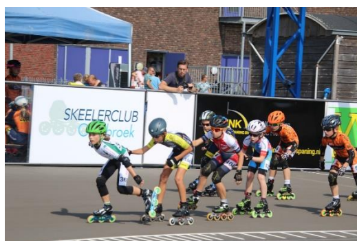
9. Nationaal pupillen toernooi Oldebroek