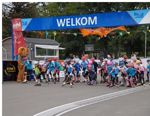
Figuur 19. Start 24minuten Kika 2019

24 minuten lang deed iedereen zijn uiterste beste om zoveel mogelijk rondes te skeelers. De Kika mascotte moedigde iedereen aan.