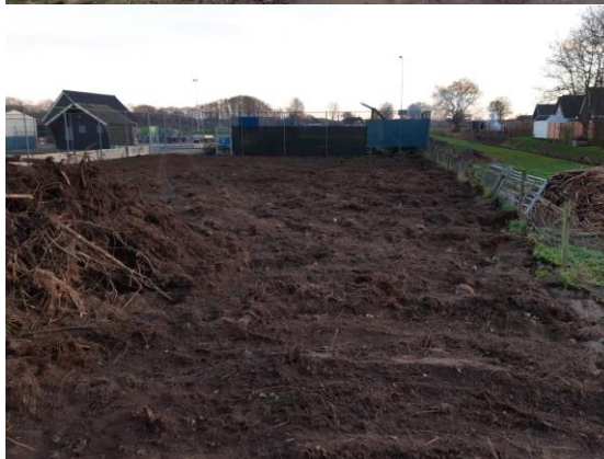
Sloopwerk oude tennisbaan