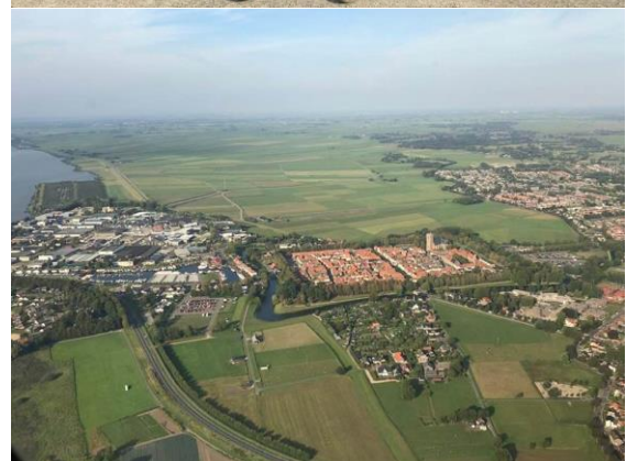
Lekker eten, gezelligheid en helikoptervluchten.