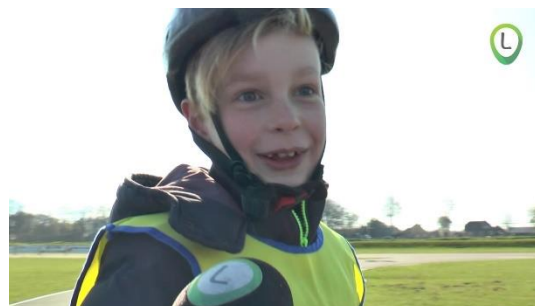
Figuur 15. Deelnemer in actie clinic

Op 12 april werden de Koningsspelen voor verschillende scholen uit Oldebroek georganiseerd in en rondom de Talter. De skeelerclub verwelkomde elke ronde 45 kinderen die een helm, bescherming en skates mochten afhalen. Nadat alles aangetrokken was kregen zij een clinic van Alise, Alyne of van de studenten van de Hanzehogeschool Zwolle.