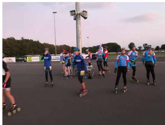
2. Een trainingsavond in 2019

Woensdagavond is de trainingsavond van de recreanten. 2019 was voor hen een matig jaar, veel training vielen uit door regenval. Er is een vaste groep van 15 tot 18 sporters die bijna elke training aanwezig zijn. Maar is het een keer heel mooi weer, dan kan het zijn dat er 30 rijders op de baan staan.