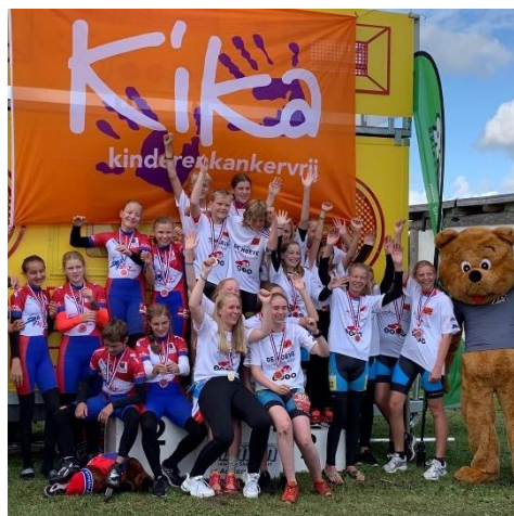
Figuur 20. Kika 2019