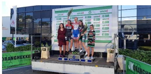
8. Podium 't Harde