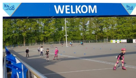
Figuur 1 Welkom bij skeelerclub Oldebroek