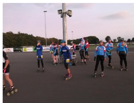
Figuur 3. Een trainingsavond in 2020

Op donderdagavond werd de opleidingsgroep aangevuld met rijders die deelnemen aan de Stouwdamcompetitie.