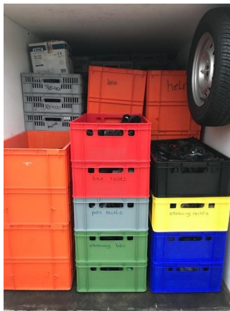
Figuur 19. Activiteiten NL Doet