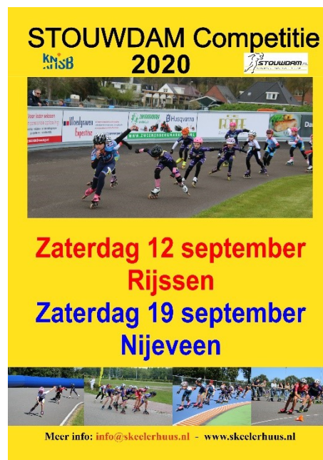
Figuur 16 Affiche Stouwdamcompetitie 2020