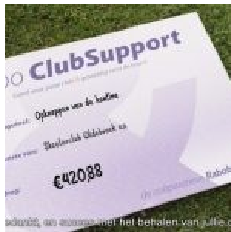
Figuur 22. Rabo Clubsupport

De Raboclubsupport actie heeft onze club een bedrag van €420,88 opgeleverd. Iedereen bedankt voor het stemmen!