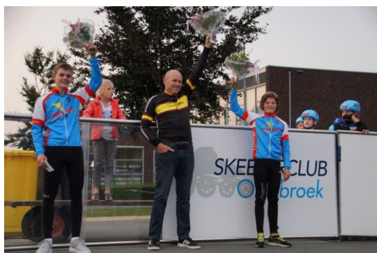
Figuur 15 Huldiging NK podiumwinnaars 2020