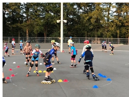
Figuur 25 Zomerspelen

Dinsdagavond 6 oktober organiseerden we een speciale training voor de jeugd met veel verschillende spelen.