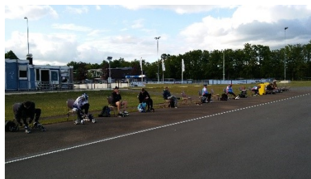
Figuur 4 Volwassenentraining 1,5m afstand