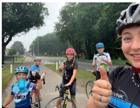
Figuur 5 Fietstraining

In samenwerking met STG Elburg zijn wij gestart met fietstrainingen voor de oudere jeugd.