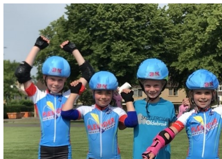
Figuur 20 Opening skeelerbaan Harderwijk

17 juni 2020 mochten we vanuit SC Oldebroek een kleine demonstratie geven bij de opening van de skeelerbaan in Harderwijk. Vier stoere dames uit Hulshorst en Hierden hebben laten zien we ze kunnen. Daarbij showen zij ook de nieuwe helmcaps gesponsord door B&K Metselwerken waarmee we in 2020 voor het eerst hebben gereden tijdens onze clubwedstrijden.