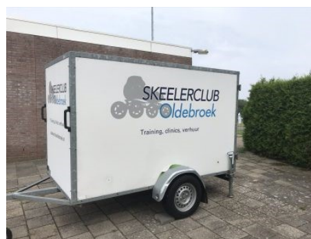
Figuur 2 Vernieuwde uiterlijk skeelerkar

De skeelerkar is vernieuwd met ons logo en naam.