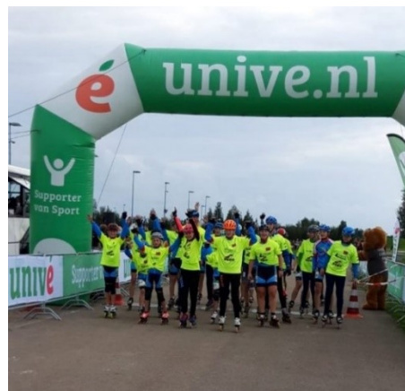
Figuur 26. Finish 24Kika 2020