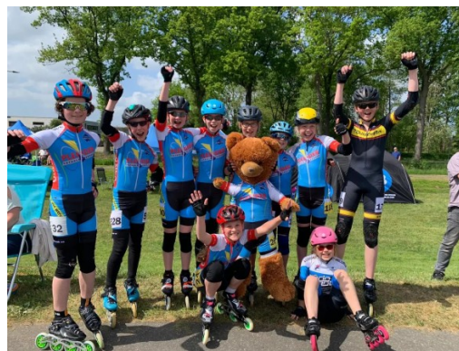
Figuur 64: Deelnemers Stouwdamcompetitie 2022 met hun mascotte