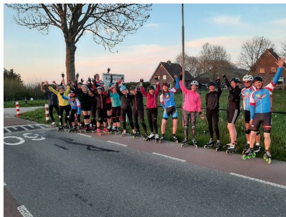
Figuur 5: Volwassen leden tijdens toertocht

Ook dit seizoen hebben we af en toe een toertochtje in de omgeving gemaakt of langs de IJssel.