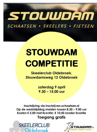
Figuur 42: flyer marathon

Klik hier voor het eindklassement Stouwdamcompetitie 2022.