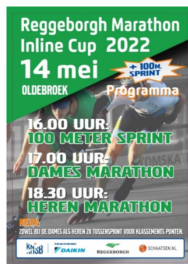
Figuur 32: flyer marathon