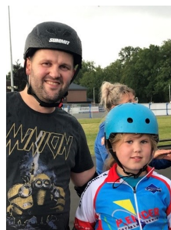
Figuur 20: Flyer Open Dag 2022