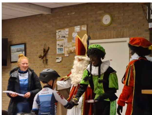
Figuur 15: Hoog bezoek

Dinsdagavond was er hoog bezoek op de baan. Want opeens zagen wij onze Sint en pieten staan! Na een hele avond hard gestreden, mochten alle kinderen daarna hun skeelerpietendiploma in ontvangst nemen!!