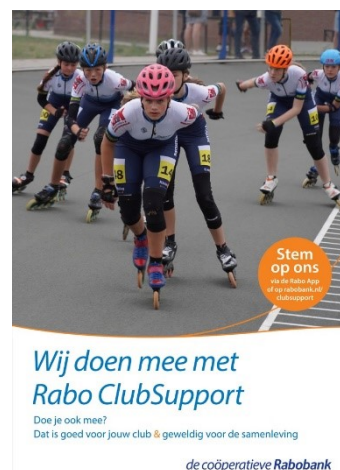
Figuur 21: Flyer RaboClubSupport 2022