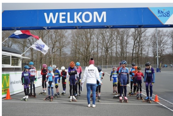
Figuur 63: Aan de start in Oldebroek Stouwdamcompetitie 2022