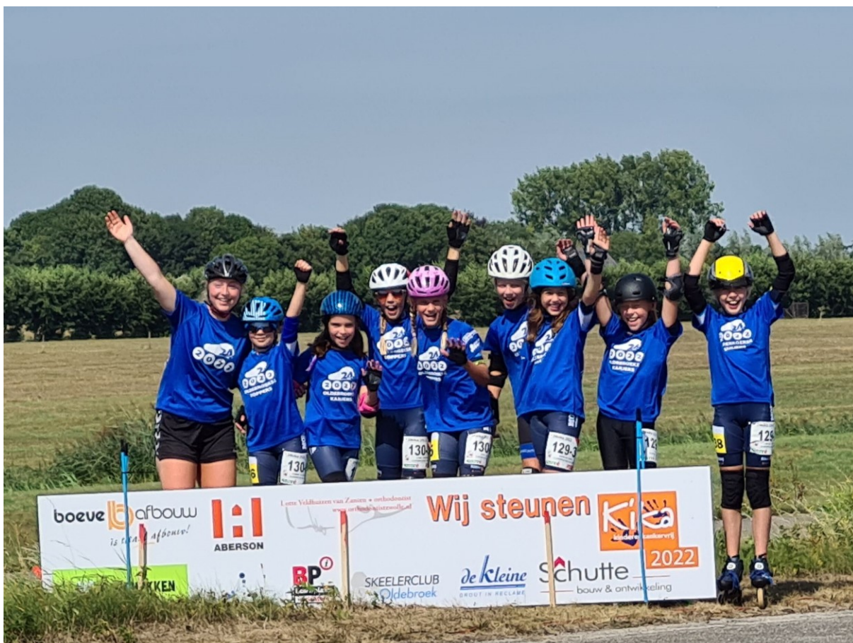
Figuur 22: Kika 2022 sponsorfoto's

KiKa 2022 heeft een totaalbedrag van ruim zestigduizend euro opgebracht. Dit gaat naar het onderzoekscentrum in Utrecht.