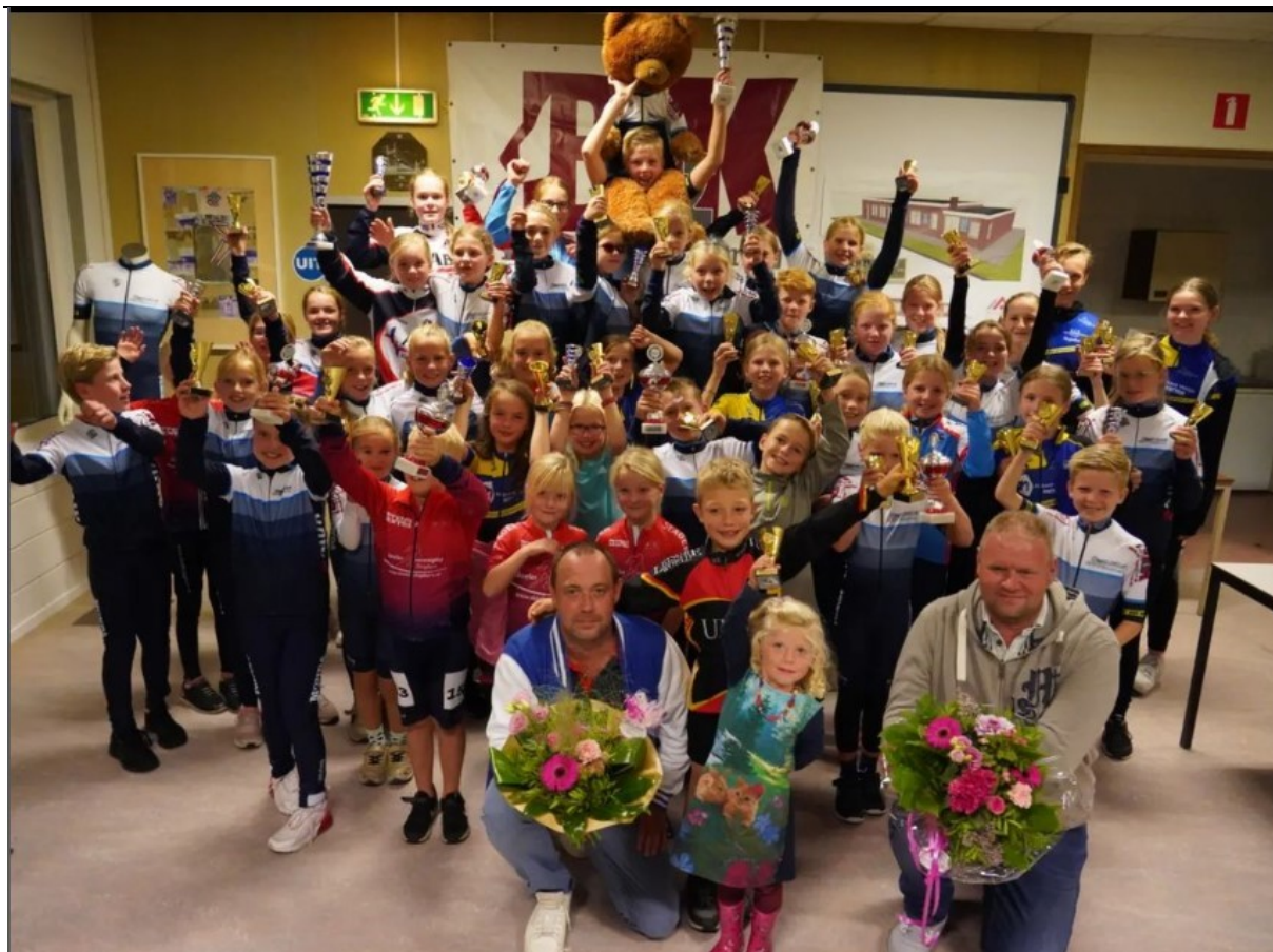
Figuur 86: B&K metselwerken competitie 2022 prijsuitreiking