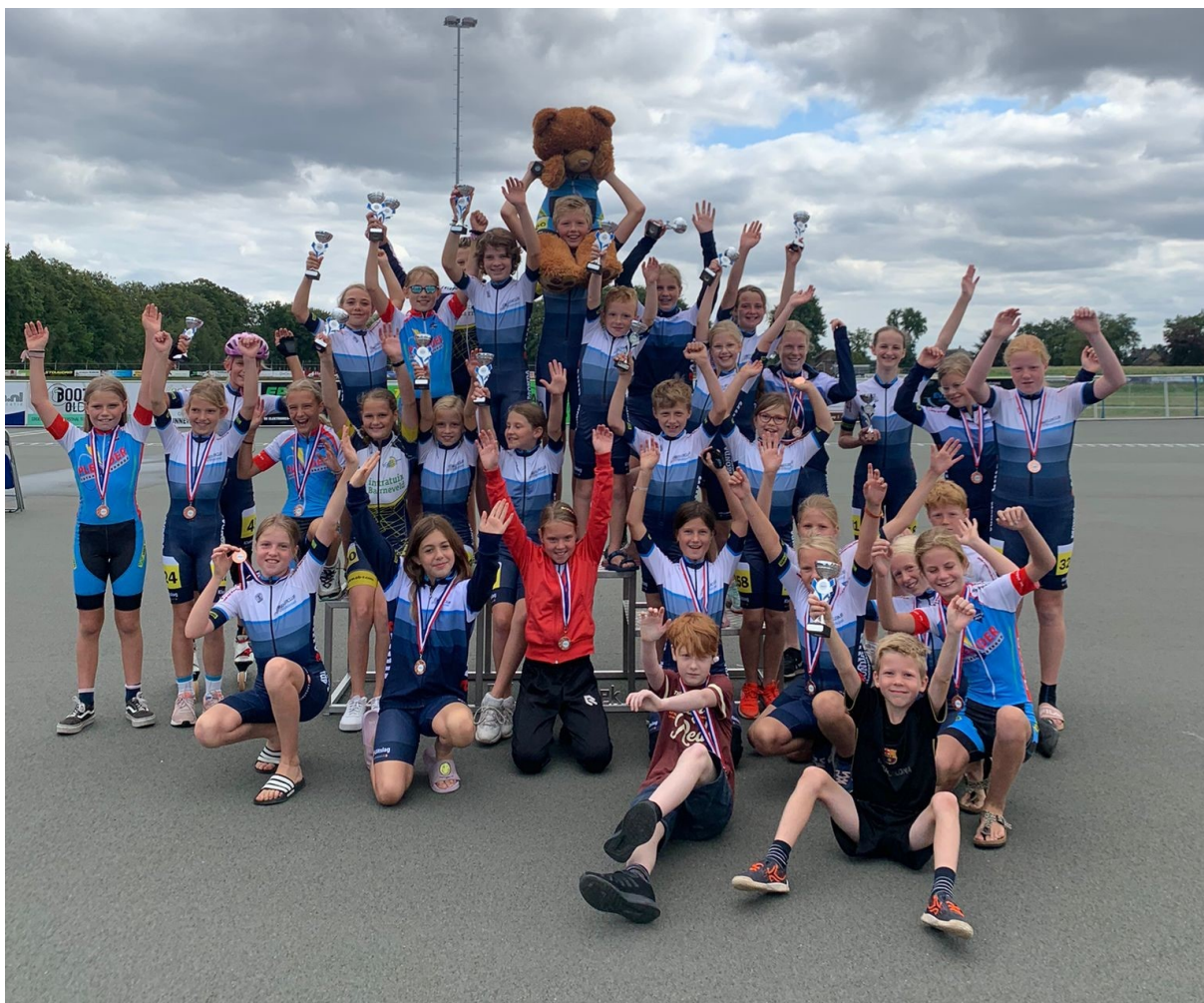
Figuur 108: Huldiging deelnemers clubkampioenschappen!