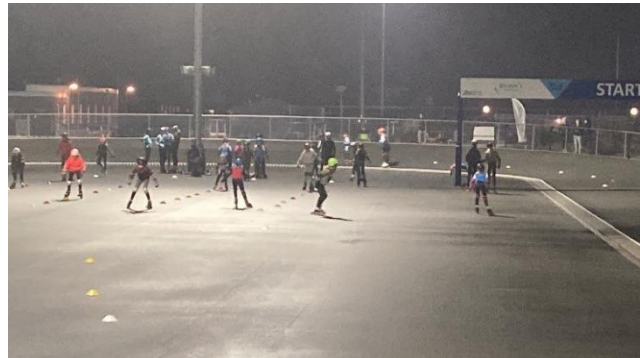
Figuur 6: Jeugdwintertrainingsavond.

Ook de volwassenen hebben als het weer dat toeliet getraind op de woensdagavond.