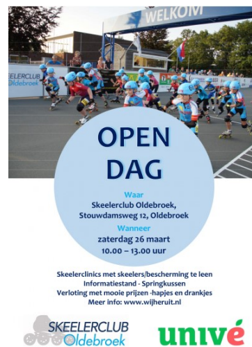
Figuur 119: Flyer Open Dag 2022

De Raboclubsupport actie heeft onze club een bedrag van € 686,18 opgeleverd. Iedereen bedankt voor het stemmen!