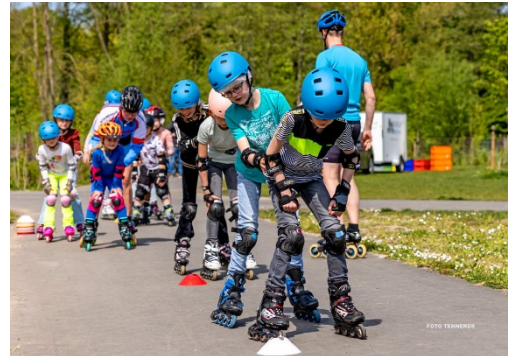
Figuur 7: Clinic Kampen

Er waren nog een aantal clinics door o.a. stichting Wiel aangevraagd, maar door regen of te weinig animo gingen deze helaas niet door.