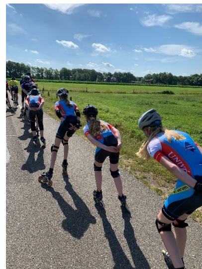
Figuur 4: 12+ groep tijdens toertocht

Dinsdag- en donderdagavond werd er vervolgens getraind door de wedstrijddrijders en oudere jeugd. Ook dit jaar was er de groep 12+, voor nieuwe en huidige leden van 12 jaar en ouder die zich minder thuis voelde op het eerste jeugduur.