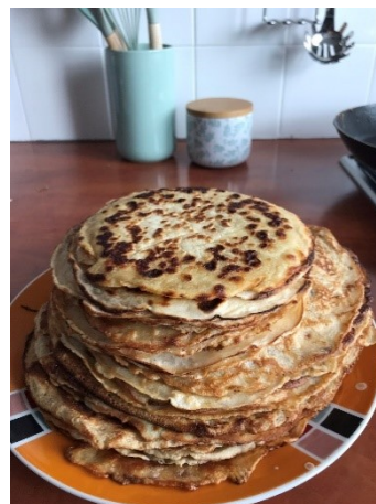
Figuur 97: pannenkoeken!

Je vindt hier de foto's en de volledige uitslag van de clubkampioenschappen.